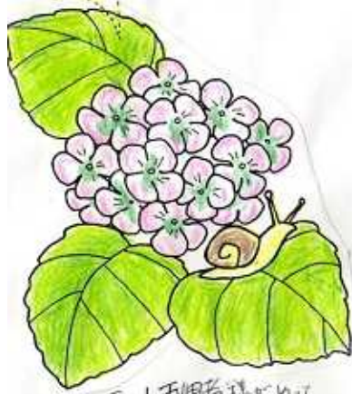
ショート利用者科のゆづり はあじさいの。