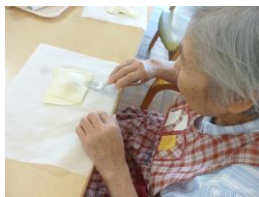
パイのふちを飾ります