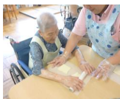
生地をのばします