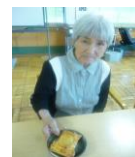
完成！いただきます～す