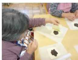
あんこを詰めます