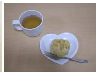
酒粕とゴマの蒸しパン