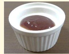
<おやつ> ミルク金時ゼリー