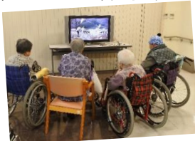
【歌が大好き! カラオケで熱唱!】