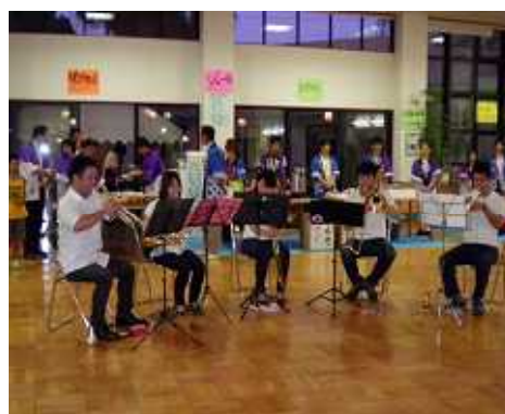
サイレント・プラスによる演奏もありました。