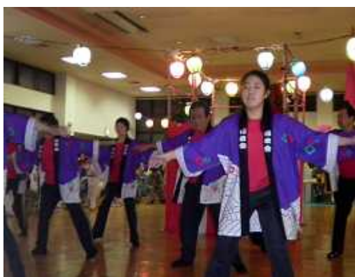
南中ソーラン、皆カッコイイ！！

毎年夏祭りに協力して頂いている合川、天名地区の皆様、ありがとうございました。また、ボランティアの皆様、当日ご参加いただいた皆様、ありがとうございました。