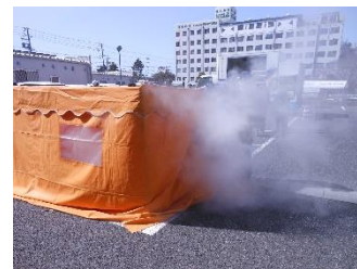
ケアハウスソレイユ 3月行事予定